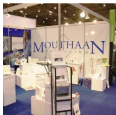
Printpanelen per meter (2,5m hoog) ... m X € 100,00