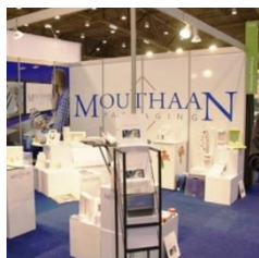
Printpanelen per meter (2,5m hoog)