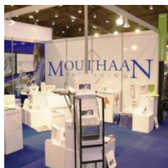
Printpanelen per meter (2,5m hoog)